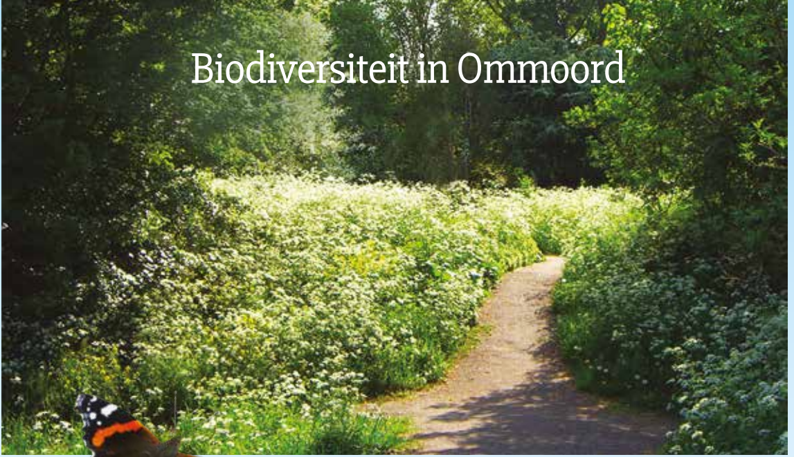
Wijk tuin Ommoord

22 Op de website van Rotterdam Weerwoord vind je een Natuurindicatiekaart (NIK). Op deze kaart zie je hoeveel natuur er in elke wijk is. De verschillen zijn groot, in de toptien van groenste wijken staat Ommoord op de vierde plaats na Hoek van Holland, polder Schieveen en Kralingse bos. Dat is iets om te koesteren!