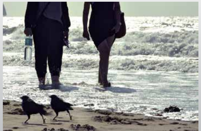
Foto Werkgroep Ommoord komt iedere dondagavond bij elkaar in de recreatiezaal van de Joliotplaats, nr. 2, Ommoord. Aanvang 20.00 uur. Iedereen die van fotografie zijn hobby wilt maken, is van harte welkom.

Daarnaast wil Foto Werkgroep Ommoord vooral een gezellige vereniging zijn, waar iedere vrijetijdsfotograaf welkom is. Het doel is vooral om van elkaar te leren en met elkaar een gemeenschappelijke interesse in fotografie op een creatieve en enthousiaste wijze te delen.