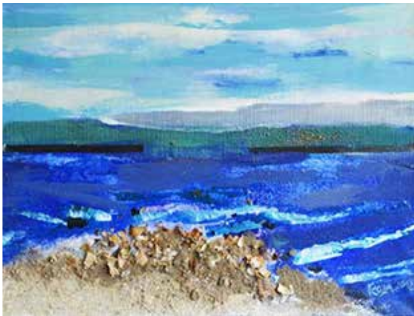
Roza's schilderij Zwarte Zee

Het project wordt begeleid door Bewonersstichting De Witte Bollen, beheerder van de Ommoordse kunst in de buitenruimten. Deze Stichting zal zich na realisatie ook ontfermen over het beheer en deze muurschildering en het verhaal er achter meenemen in haar jaarlijkse Kunstroute door Ommoord.