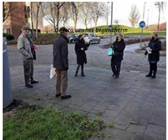
De foto van het beginscherm