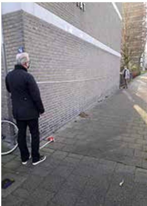
Metten is weten

De aanduiding op de Nansenplaats wordt vanaf de Rottedijk zichtbaar en visualiseert de verbinding tussen Ommoordse Veld en de bebouwing daarom heen.